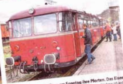
Auch die Christuskirche in Gerthe (l.) und das Kulturzentrum Bahnhof Langendreer (o.r.) öffnen am Sonntag ihre Pforten. Das Eisenbahnmuseum in Dahlhausen lädt zur historischen Eisenbahnfahrt mit dem Schienenbus ein.