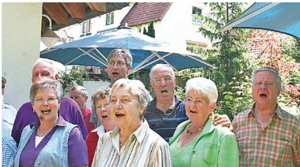
„Day of song“ vor dem Teehaus

Eine Gruppe aus Mitgliedern der Frauenhilfe und Mitarbeitenden der „Offenen Kirche“ vor dem neuen „Ruhr-Museum“ auf dem Gelände der ehemaligen Zeche Zollverein in Essen (Weltkulturerbe)