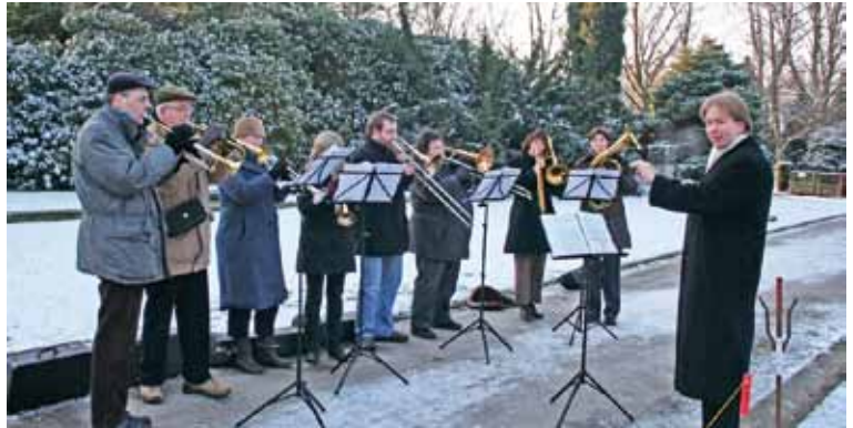
Der Posaunenchor bei einer Andacht auf dem Gerther Friedhof

die Arbeit des Posaunenchores in finanzieller Hinsicht abzusichern. Das ist bisher gut gelungen. Von Anfang an ist aber die Aufgabe des Vereins etwas umfassender formuliert worden. So hat der Verein in den letzten Jahren auch die Ar-