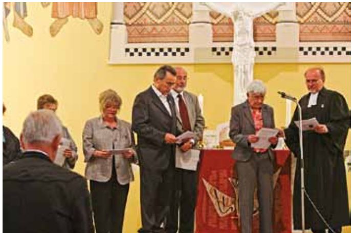
Mitglieder des Presbyteriums beim Fürbittengebet