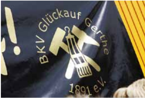
Schachtzeichen Ruhr 2010

Gewidmet dem Bergmanns- Kameradschafts-Verein Glückauf- Gerthe 1891 e.V.