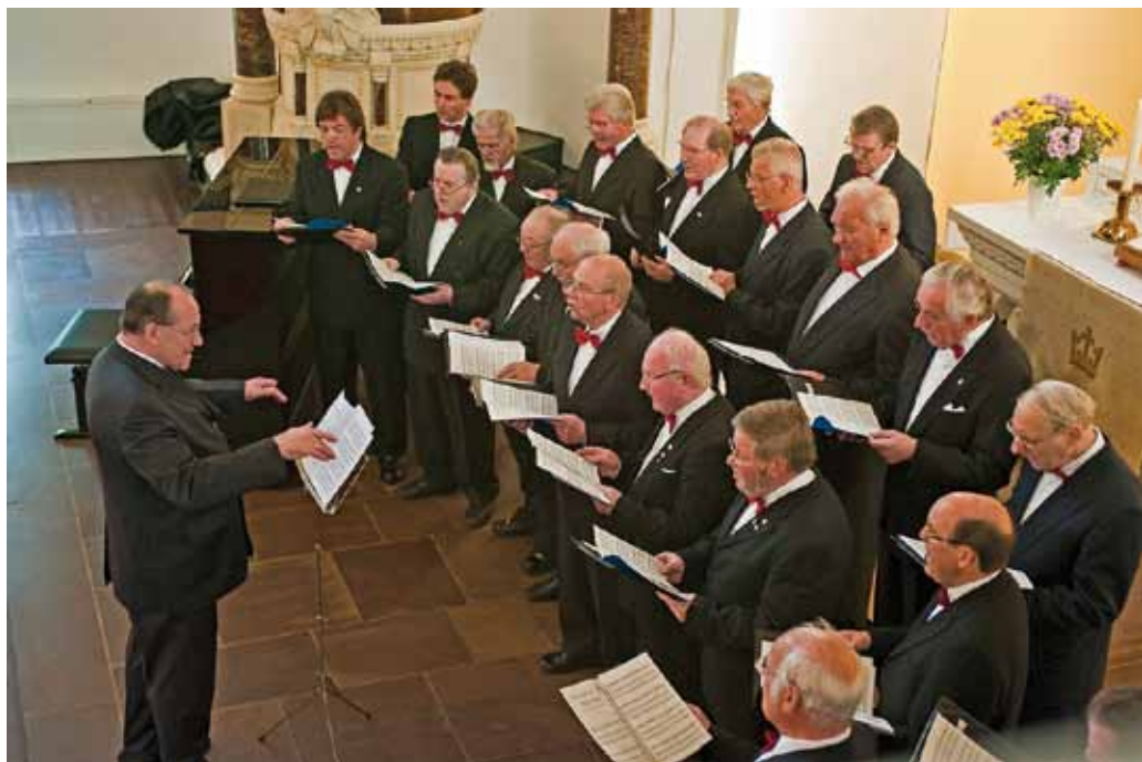
Ein Teil des Chores, ganz auf den Gesang konzentriert.

Zu den Chören, die regelmäßig in der Christuskirche auftreten, gehört die vor 130 Jahren gegründete Sängervereinigung Gerthe 1881. Seit vielen Jahren findet hier (im Wechsel mit der katholi-