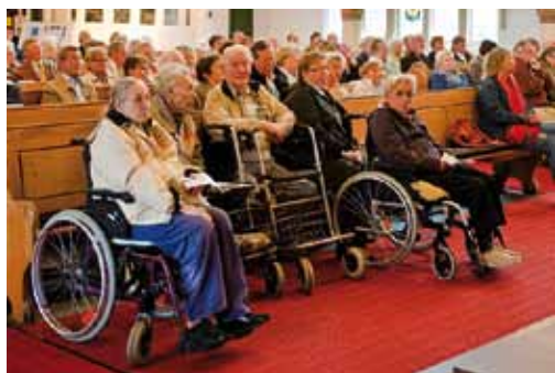
Links: Bewohnerinnen und Bewohner des Altenheims „Haus Gloria“ unter den Zuhörern.