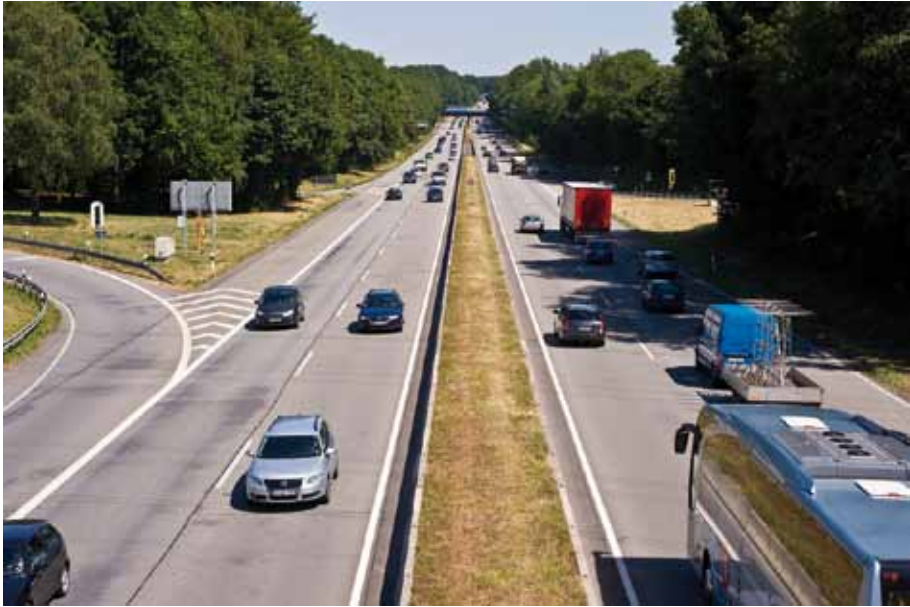
Die A 40 von der Brücke der Werner Straße in Bochum-Harpen aus gesehen (Richtung Dortmund): Keine 24 Stunden liegen zwischen diesen beiden Bildern.