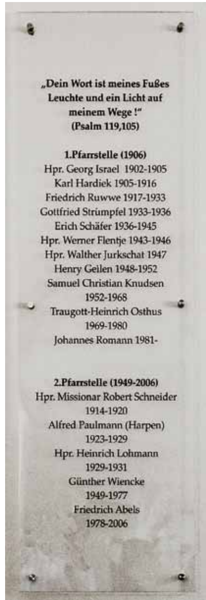
Tafel mit den Namen der seit der Gründung 1906 in der Gemeinde Gerthe tätigen Pfarrer