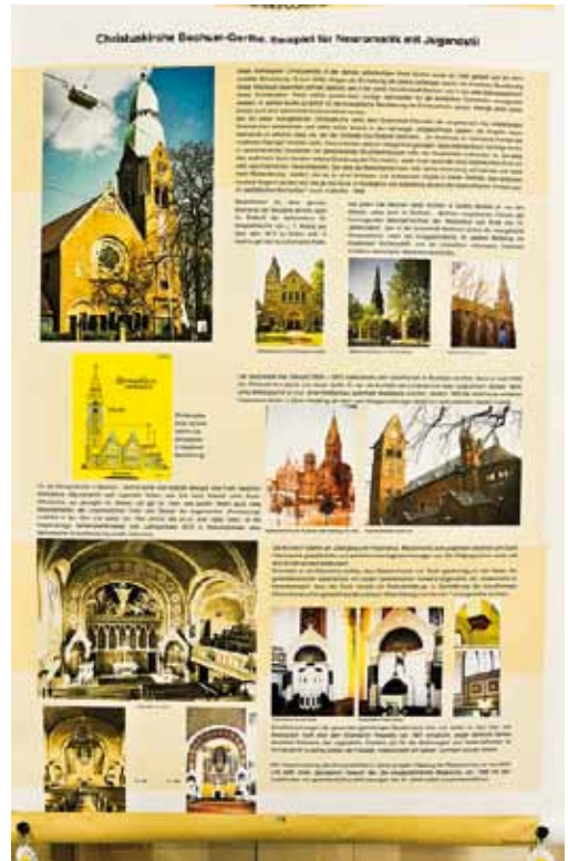
Bildtafel des Kirchenbau-Dokumentationszentrums (unten)