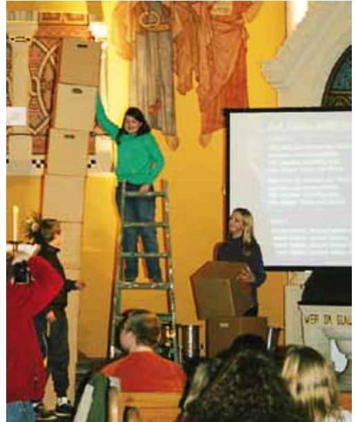
Oben: Miteinander arbeiten heißt das Gebot der Stunde.

Unter dem Motto „ einfach spielerisch “ wurde durchgespielt, was ein plötzlicher Stromausfall bedeuten kann: Möglicherweise findet sich die Familie am Tisch zusammen, um gemeinsam zu spielen oder miteinander zu sprechen.