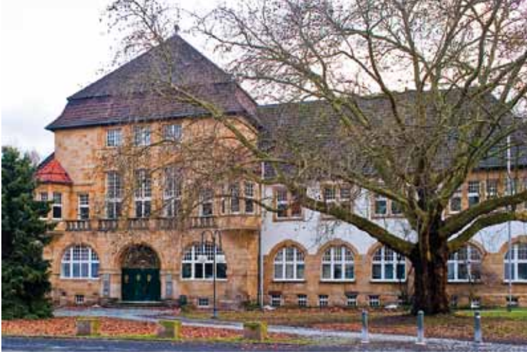
Auch das Gerther Amtshaus wurde im Jahr 1910 eingeweiht.

weiterhin vor großen Aufgaben auch in dieser Gemeinde stehen werden und neue Visionen brauchen, vertraue ich auf die Kraft und den Einfallsreichtum der Menschen hier in Gerthe.