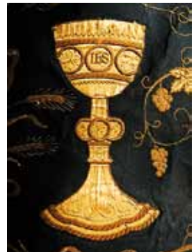
Abbildung eines Abendmahlskelches auf einem alten Altarbehang der Christus-Kirche